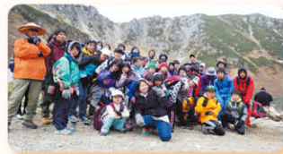
長野県駒ヶ岳登山