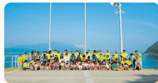
福井県若狭サマーキャンプ