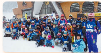
長野県きそふくしまスキー

私たちは子どもの成長・発達の原点に立ち返り、自分のまわりにいる仲間と同じ興味・課題に取り組み共有された世界が芽生えてくる過程の中で、相手への信頼が求められると考えています。どのような境遇にある親子でも孤立することがない地域社会を目指します。