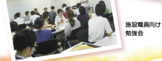
施設職員向け勉強会