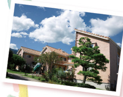
児童養護施設 別府光の園

近年、要社会的養護児童の中で、障がい等のある児童が増加しており、児童養護施設においては、23.4%にのぼっています。18歳で特別支援学校高等部を卒業、施設から出た後は、親族の支えの無いまま生活保護に頼り、就労支援のある障がい者施設での生活あるいは自立生活能力のないまま一人暮らしを強いられます。ホームレスとなったり、利用され犯罪に巻き込まれたりする危険をはるかに上回ります。