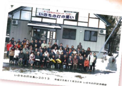
いのちの灯の集い2013