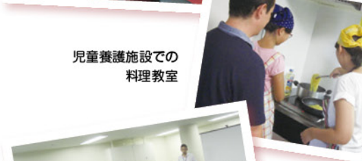
児童養護施設での料理教室