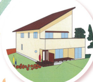
グループホームイメージ