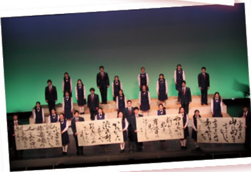
にしわが子守唄コンサート