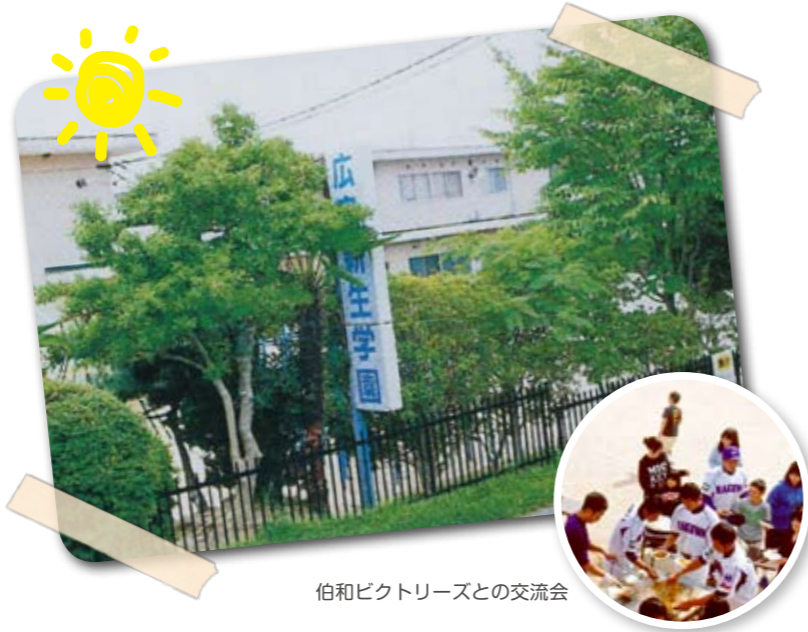
伯和ビクトリーズとの交流会